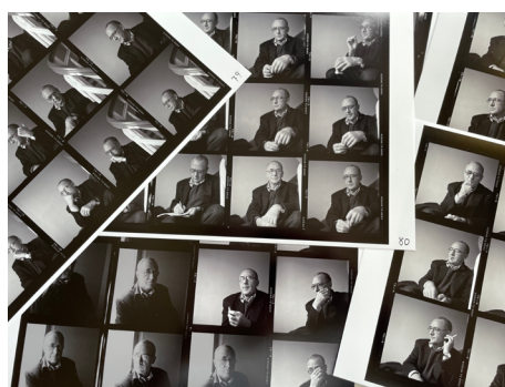
見つかった6×6のベタ焼き