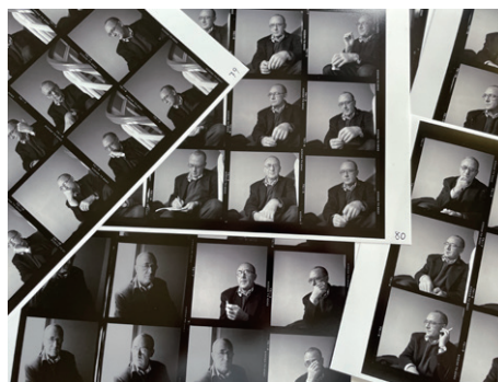
見つかった6×6のベタ焼き